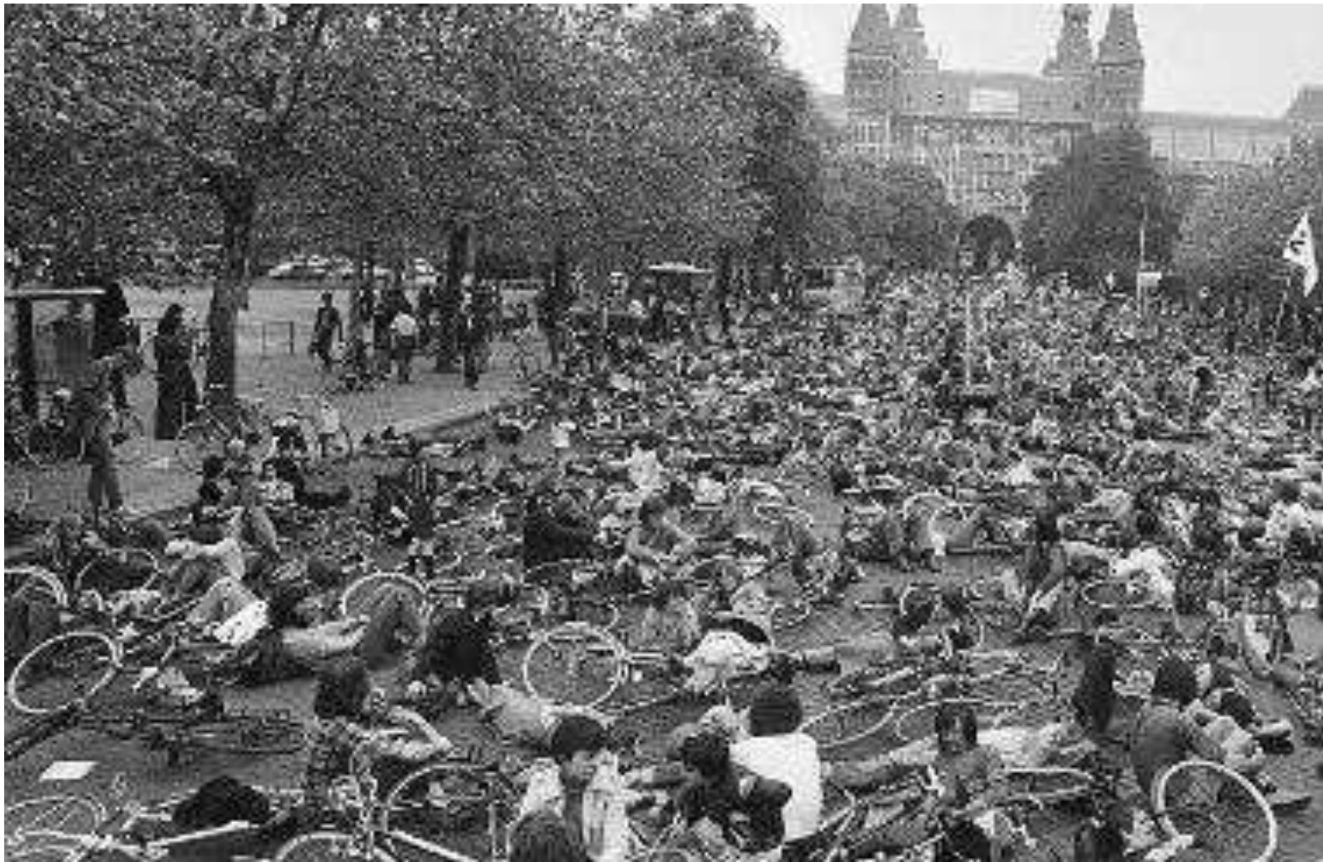
Rural bike demonstration in Amsterdam; cyclists on the floor on Museumplein to commemorate traffic victims Date: June 4, 1977